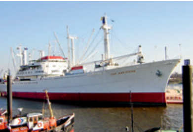
l. u. r.: © Cap San Diego