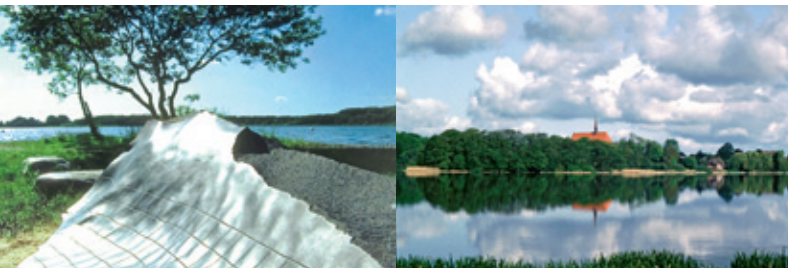
l.u.r.: © Stadt Neumünster