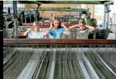
l. u. r.: © Museum Tuch + Technik, Neumünster